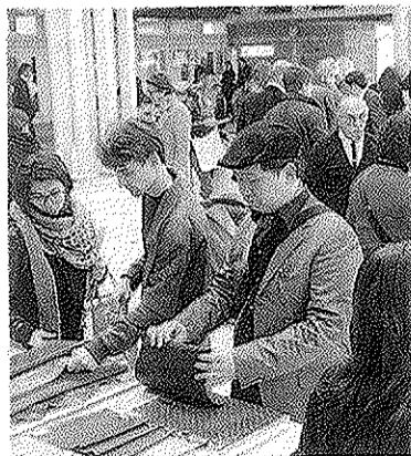
ANTEPRIMA In concomitanza con Pitti Uomo