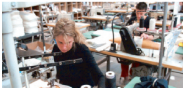
CONFEZIONI Un laboratorio artigianale